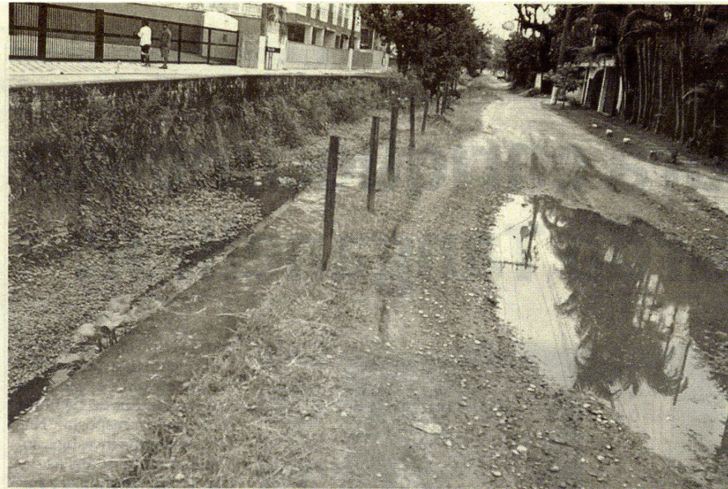
Toda a extensão da rua é de terra e a promessa é de uma completa transformação da via pública

ta a rua. Há ainda o agravante de a Rua Acre ser a única opção de desvio de trânsito, por isso muito usada por turistas, a partir do ponto onde a avenida da Praia da Enseada passa a ter um só sentido de direção.