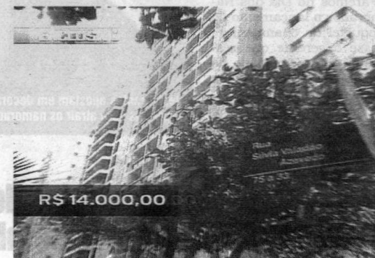
Apartamento, em Guarujá, declarado pelo delegado com valor de R$ 14 mil

Segundo o MP, até agora ele não provou a origem do dinheiro